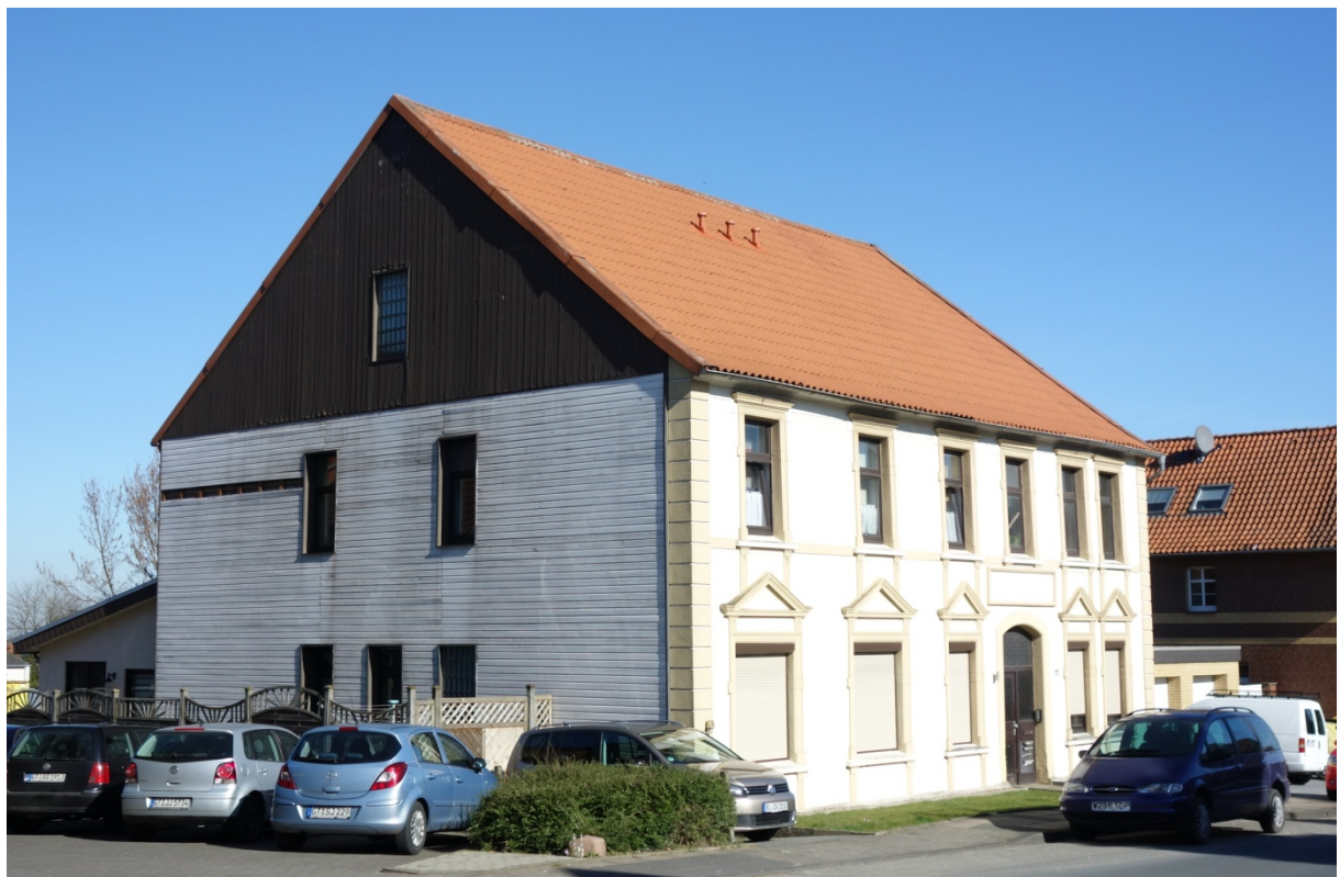
Haller Str. 12